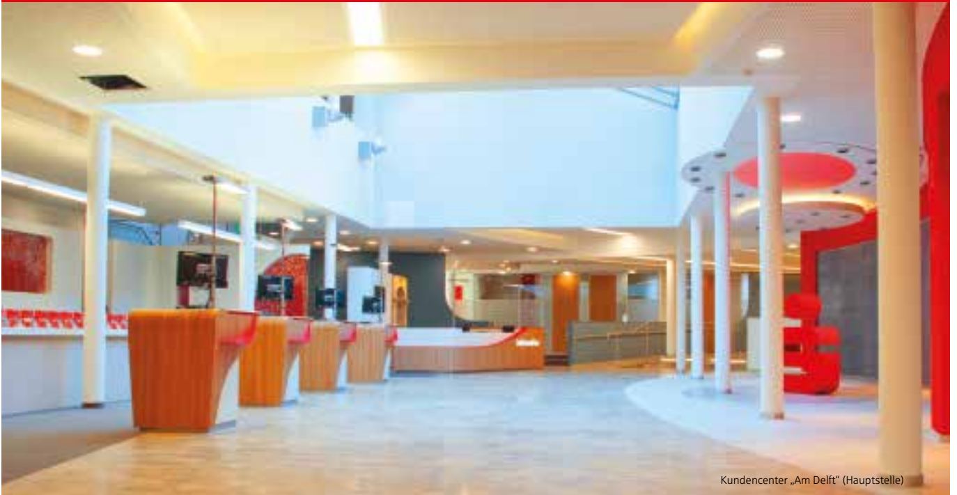
Kundencenter „Am Delft“ (Hauptstelle)